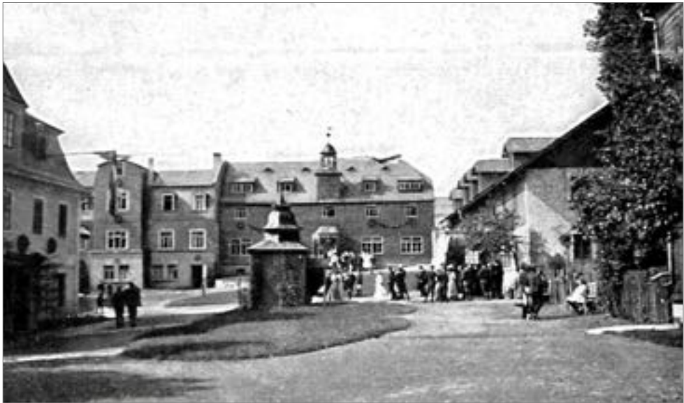
Abb. 5: Wickersdorf, Freie Schulgemeinde, ca. 1907

Es beginnt mit der Sexta, und ich habe nur zwei Volksschulklassen hinter mir. Das Überspringen von damals einer Klasse (heute wären es zwei) machte noch nichts aus.